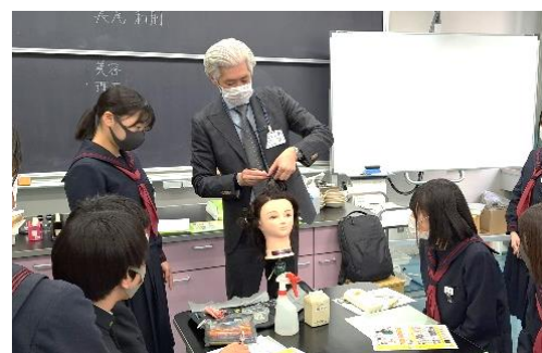
「小・中学生のハローワーク」